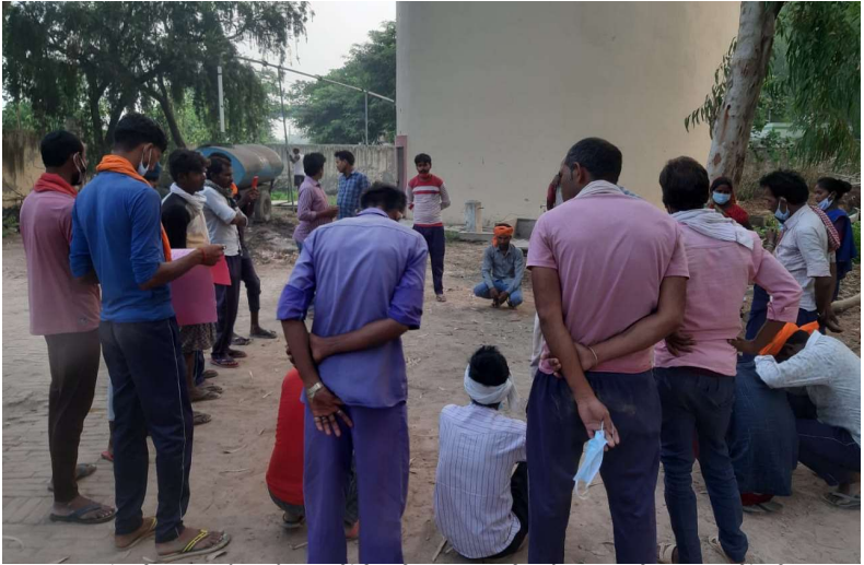
कुरसठ गाँव के सफाई कर्मचारियों ने कोविड-19 के दौरान उनके अनुभवों को करने हमारे साथ साझा किया।