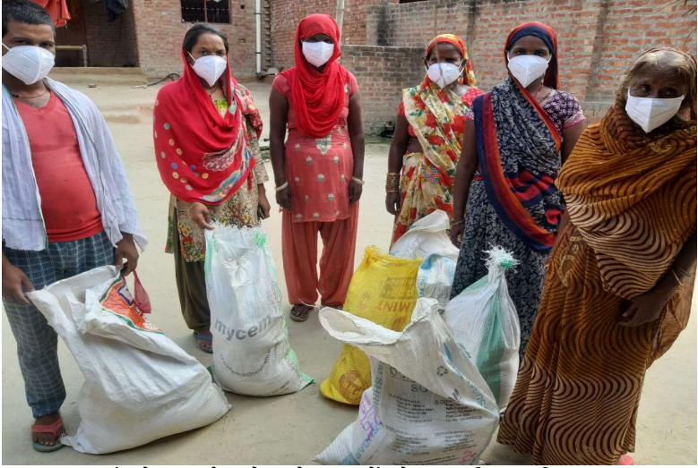
कुरसठ गाँव के सफाई करने वाले परिवारों को राशन वितरण किया गया